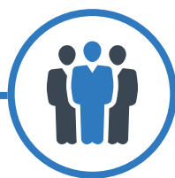
Расследования и проверки