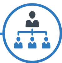
Работа с персоналом